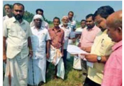
കാരിക്കൂഴി ഏലായിലെത്തിയ റവന്യൂവകുപ്പ് ഉദ്യോഗസ്ഥർ ബൈക്കർ പരിശോധിക്കുന്നു

കോർപ്പറേഷനിലുമായി പറന്നു കിടന്ന ഏലായുടെ നാശവും ഇതോടെ ആരംഭിച്ചു. ജനകീയാസൂത്രണപദ്ധതിയിൽപ്പെടുത്തി ഭൂരഹിതർക്ക് ഭൂ