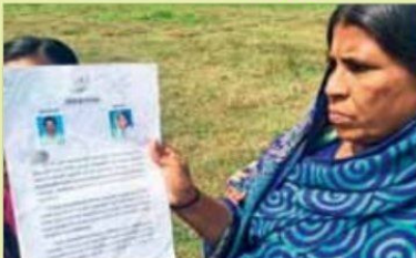
കാരിക്കൂഴി ഏലാ പതിച്ചുകിട്ടിയ വിട്ടുമാ പൂജാണമായി

കൊട്ടിയം: കാരിക്കൂഴി ഏലാ പതിച്ചു കിട്ടിയ ഗൃഹഭോജനക്കല്ലും പായുന്നതാൽ ചതിവിന്റെ കഥ. തോടിന്റെ വടക്കു ഭാഗത്തെ കരഭൂമി ചുണ്ണിക്കോട്ടിയാണ് തങ്ങളെ ഇതിൽ കുറുകിയതെന്ന് ഇവർ പറയുന്നു.